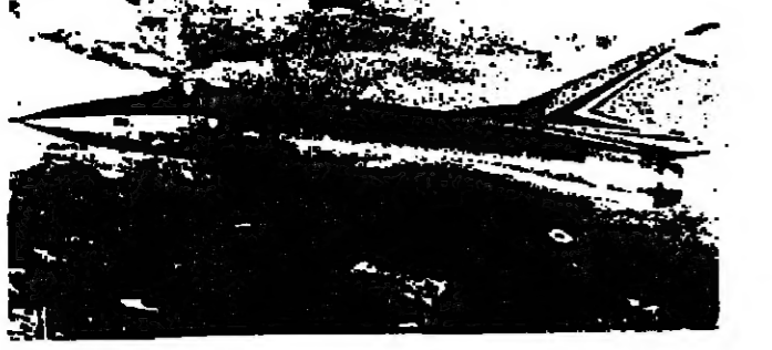
الميراج ٤٠٠٠ لصواريخ القند